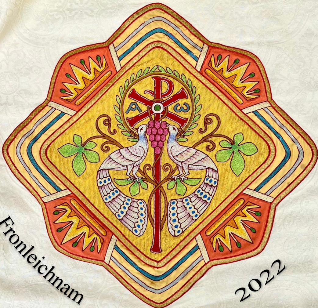
Foto: Laufelder Segenstuch