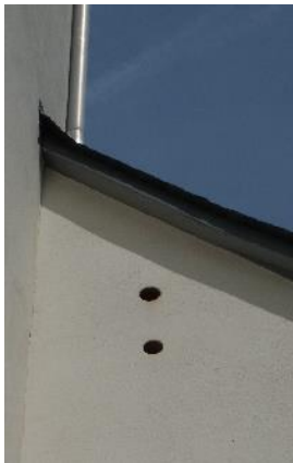
Die alte Einflugschneise