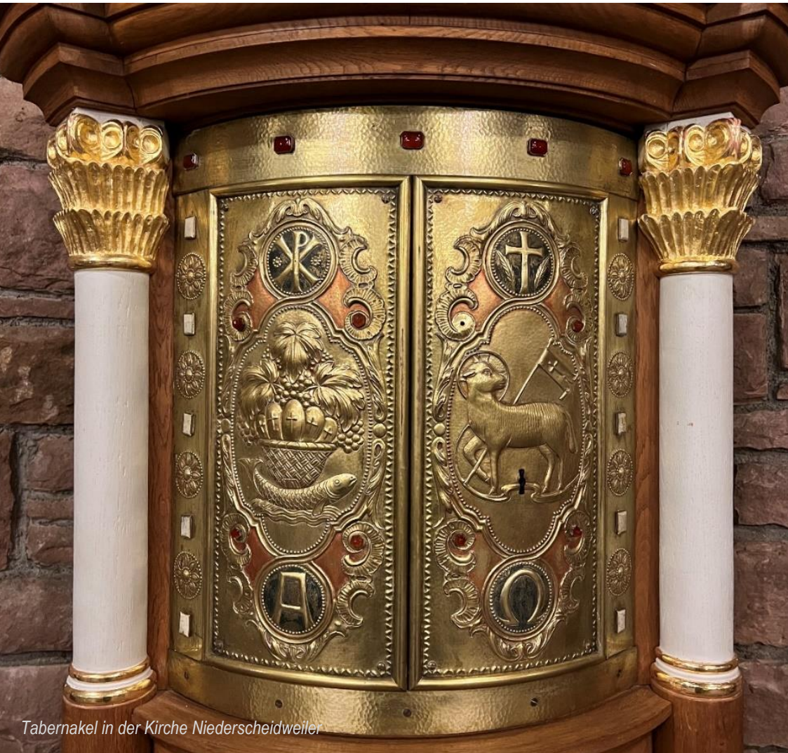
Tabernakel in der Kirche Niederscheidweiler