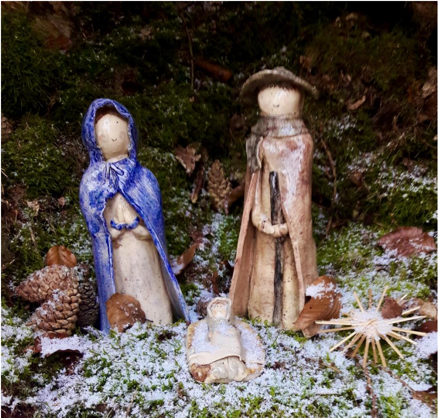
Weihnachtskrippe im Waldkindergarten Niederöfflingen

Abkürzungen: PE = Pfr. Paul Eich, Fu = Kooperator Pfr. Jürgen Fuhrmann,