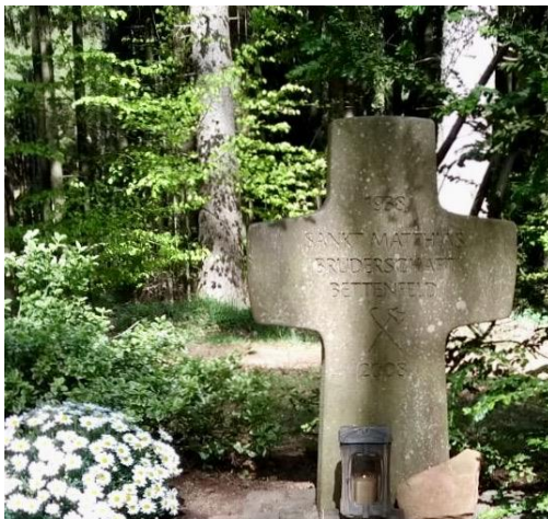
Bettenfelder Pilgerkreuz hinter Heidweiler.

Am 24. Februar feiern wir das Fest des hl. Matthias. Die Bruderschaft gedenkt in einer hl. Messe allen Lebenden und Verstorbenen der Bruderschaft Bettenfeld, sowie den Pilgerinnen und Pilgern. Den genauen Termin der hl. Messe bitte dem aktuellen Pfarrbrief entnehmen. Da keine Mitgliedsbeiträge mehr erhoben werden, können gerne freiwillige Spenden abgegeben werden. Für die Bruderschaft Bettenfeld Werner Steines (Brudermeister)