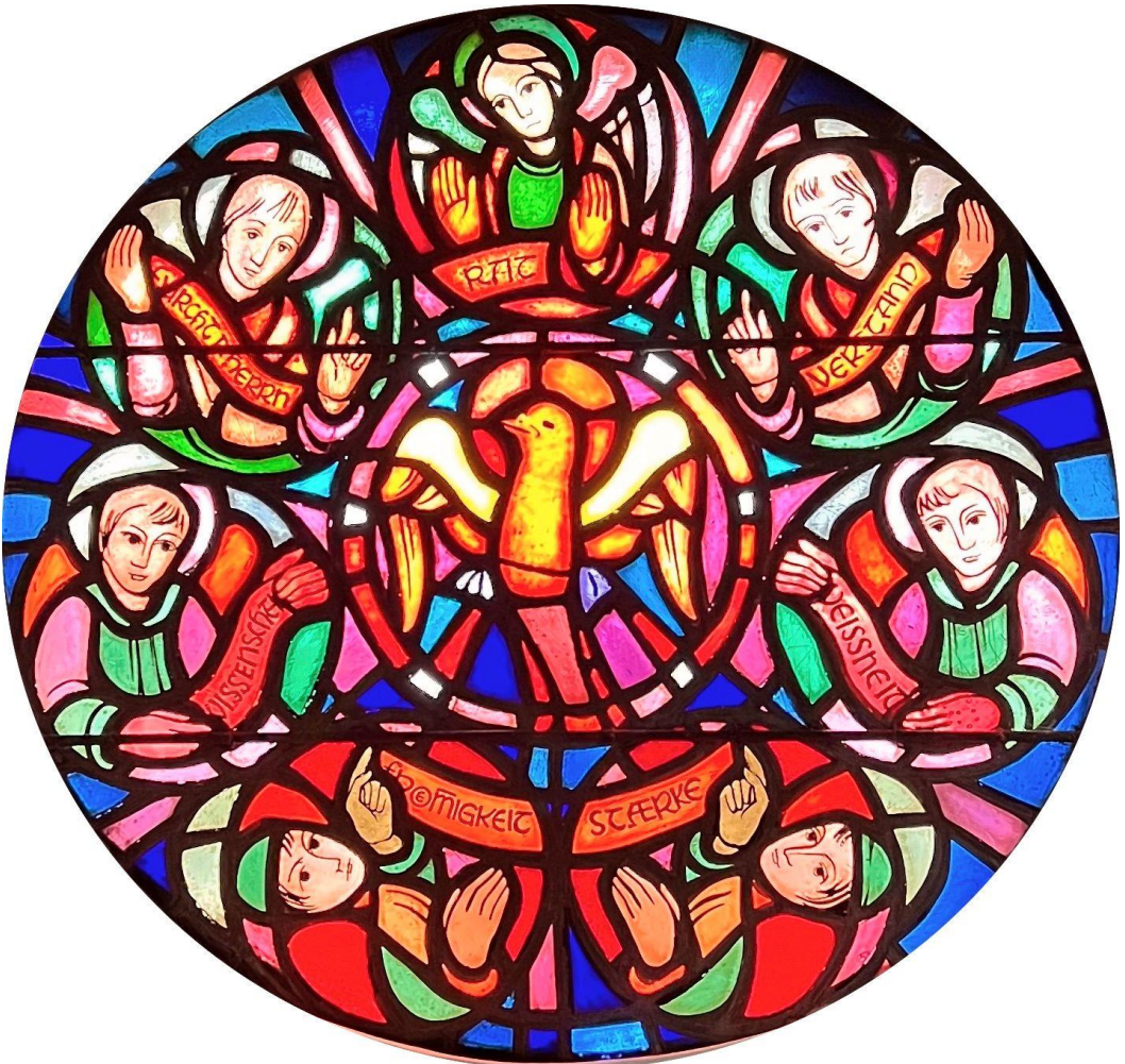
Das Pfingstereignis dargestellt in einem Kirchenfenster in der Pfarrkirche Steffeln