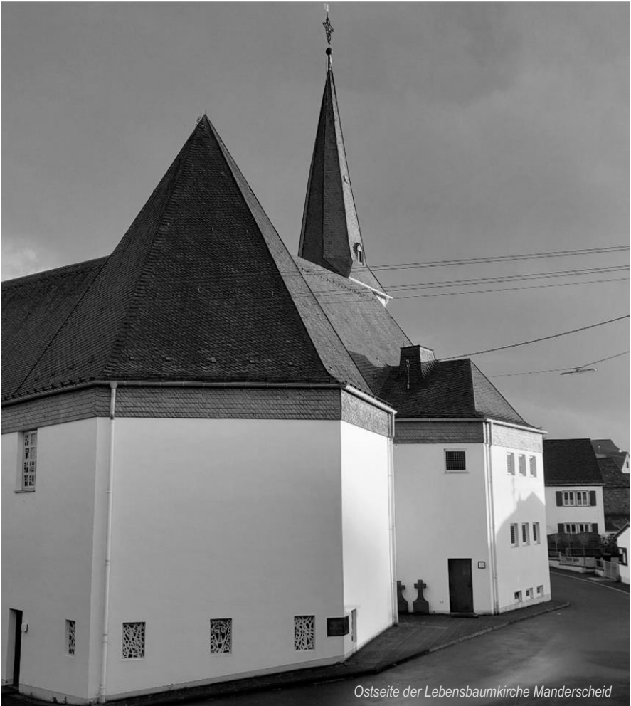
Ostseite der Lebensbaumkirche Manderscheid